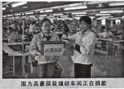
图为英豪服装缝制车间正在捐款

今年以来,中国纺织服装行业发展受到了人民币持续升值、货币政策趋紧、原材料和劳动力成本上升等一系列因素的影响,给服装行业带来了极大的挑战。然而泰慕士公司的各项经济指标却全面飘红,1至5月实现销售收入超亿元,比去年同期增长30%,创历史最好水平。