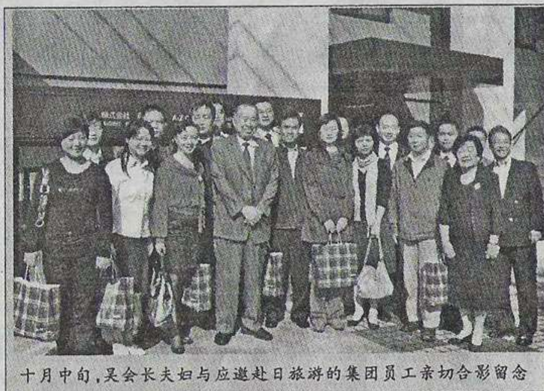
十月中旬,吴会长夫妇与应邀赴日旅游的集团员工亲切合影留念

第15期 内部读物免费赠阅 网址: http://www.azazaz.com 邮箱: aztoday@azazaz.com