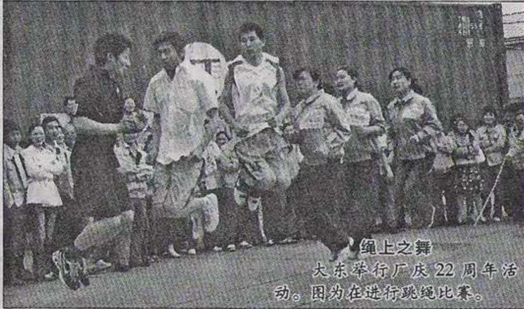
绳上之舞 大东举行厂庆22周年活动。图为在进行跳绳比赛。

有这么一群人,晨曦中,他们精神饱满,脚步匆匆地踏入泰慕士的大门,夜幕下,他们披着满身的星光,拖着疲惫的身躯融入在茫茫的夜色中,行走在各自回家的路;有这么一群人,他们可亲、可爱、可敬,他们兢兢业业,勤勉,奋进;有这么一群人,他们是父母,是儿女,是丈夫,是妻子,但他们还有一个让他们值得骄傲,值得珍惜的身份——泰慕士人。 这是一群可亲的人。他们相亲相爱,互帮互助。在泰慕士这个大家庭里,他们是兄弟姐妹,至友亲朋。在生产高峰期,在交货密集期,刚刚结束本车间高峰期的他们还没来得及喘一口气又加入了整检车间的高峰战斗中,还有他们,暂停了科室工作任务也加入了包装工的行列,拿惯了笔,按惯了键盘的手指在包装时也是那样的灵巧、娴熟。在完成了包装任务后,他们又默默地坐到办公桌前加班加点。前道帮助后道,科室帮助车间,就连培训班的小姑娘们也成为了一支强大的生力军共同迎战高峰。就是这样不分彼此,亲如家人的一群人让泰慕士这个大家庭充满着凝聚力。