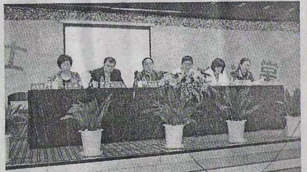
泰慕士公司与南通大学进行产学研合作培训,图为5月7日开学典礼现场。

在生产一线的广大党员说,要以更高的标准、更新的姿态创造一流的工作业绩,打造一流的党员队伍,在公司中起到模范带头作用,共同奋力拼搏,来克服一切的困难,努力完成今年的生产目标和任务,为六安英瑞公司的发展做出更大贡献。(六安英瑞 办公室)