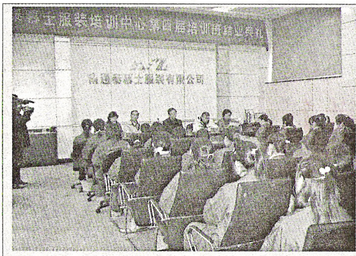
泰慕士公司第4期服装培训班结业,加总出席结业典礼。